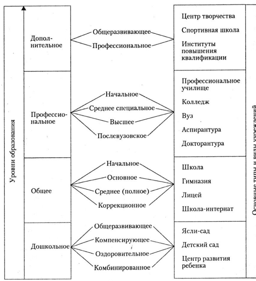
Рис.1.1. Система образования в России